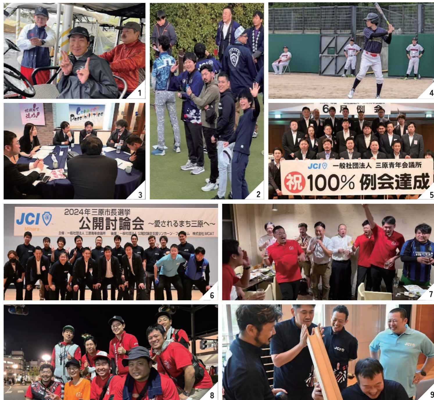
1 OB現役交流ゴルフ大会 2 広島ブロックゴルフ大会 3 4月例会～地域とまちづくり～ 4 広島ブロック野球大会 5 6月例会 6 公開討論会 7 やっさ祭り決起集会 8 第49回三原やっさ祭り 9 8月例会～スポーツ交流～