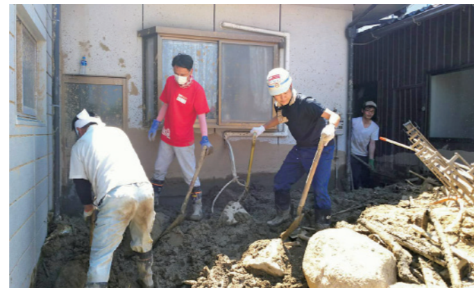
ボランティアで瓦礫の撤去を行う青年会議所会員 住宅に流れ込んだ土砂の撤去作業