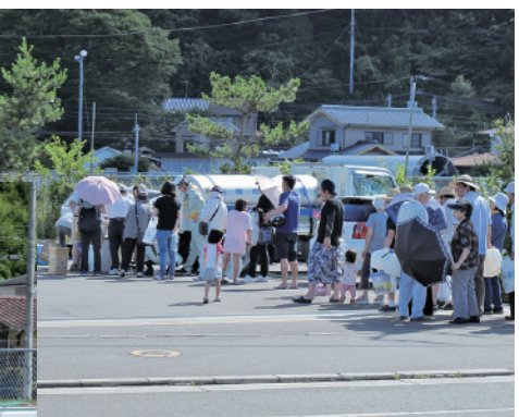
断水の為設けられた給水所に多くの人々が水を求めた糸崎神社前立地給水所