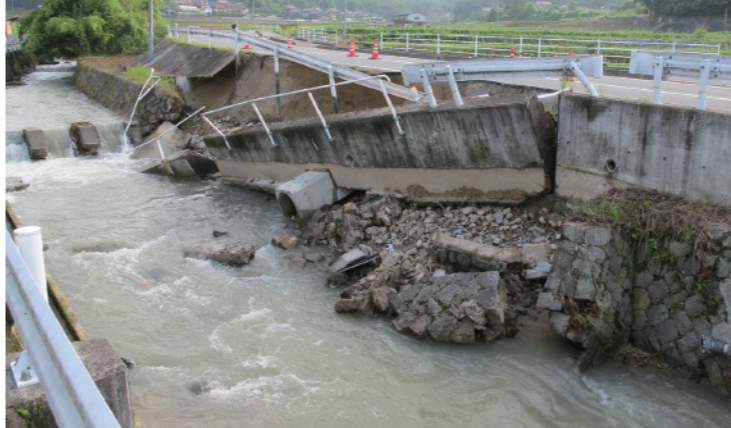
高坂町を流れる河川の水流で削られた歩道