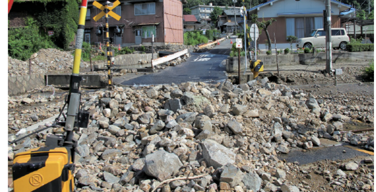
土砂が流れ込んだ糸崎の踏切